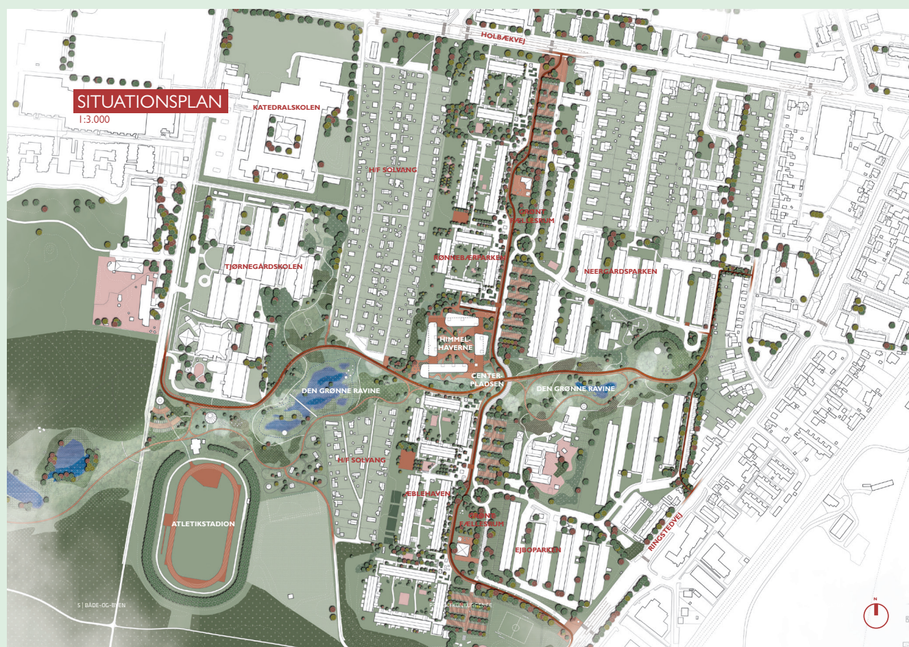
Situationsplan forslag 1 - fase 2

end de øvrige ved i høj grad at optimere områdets attraktivitetsniveau og skabe et narrativ, som tager fat i den eksisterende store skala, i landskabet og et detaljeret greb om løsningen og nedskaleringen af det trafikale forløb. Gennem de tre overbevisende delområder, Centergrunden-Himmelhaverne, Trafikforløbet-Almindingen, Parkforløbet-Den Grønne Ravine, er forslaget i sidste forhandlingsforløb igen er