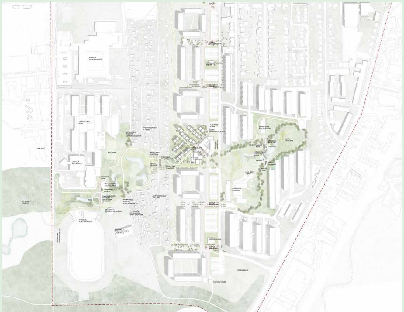
Situationsplan forslag 3

en vendesløjfe nord for Centergrunden, hvilket dommerkomitéen ikke anser som en god løsning, da der vil være for langt til Æblehaven herfra. Der er ikke redegjort for antallet af parkeringspladser med den anviste løsning.