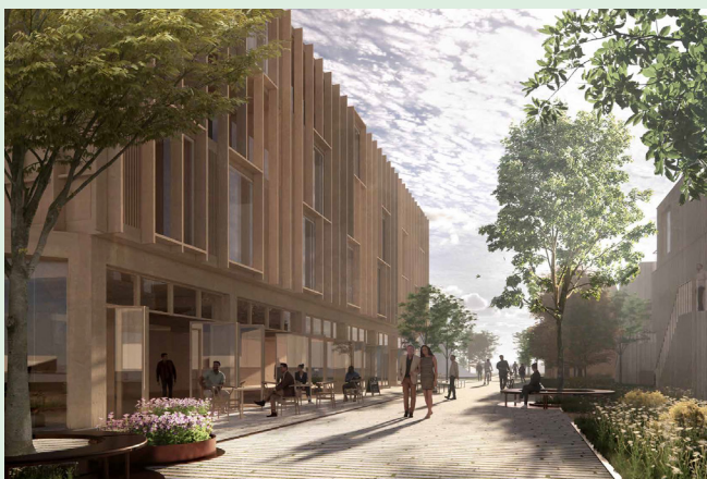
Illustration forslag 3

UNDERRÅDGIVERE: SKALA ARKITEKTER A/S (OPHAVSRET) ARKI_LAB APS RAMBØLL A/S TRAFIKPLAN APS