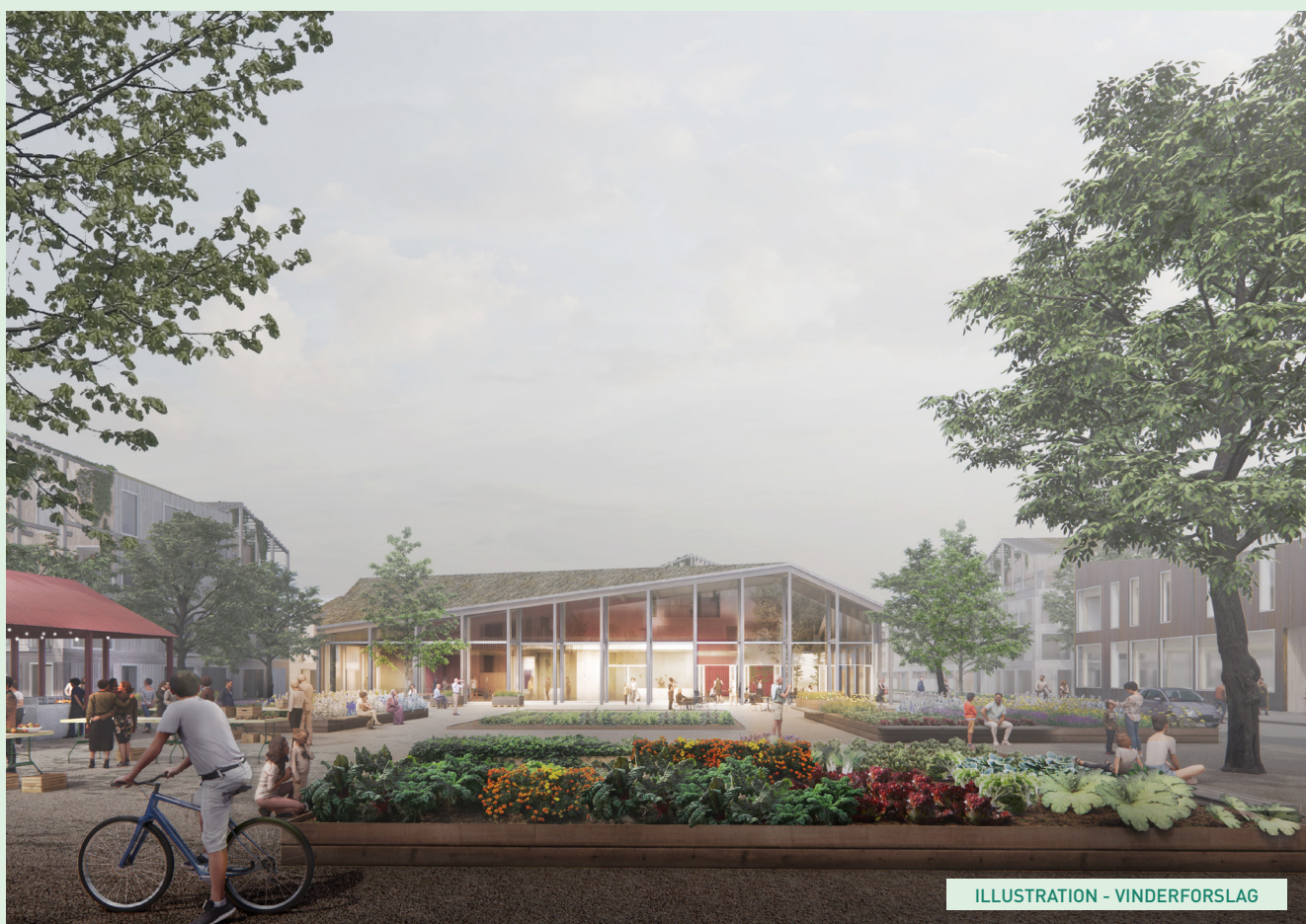
ILLUSTRATION - VINDERFORSLAG

Samlet set står forslaget stærkt og konsistent gennem vision, strategi og gennemgående valg både på boligdel som trafik og parkforløb. Forslaget udnytter stedets egne muligheder og ressourcer både landskabeligt og socialt. På den baggrund har dommerkomiteen udpeget dette forslag som delt vinder af fase 1 og teamet inviteres til forhandling.