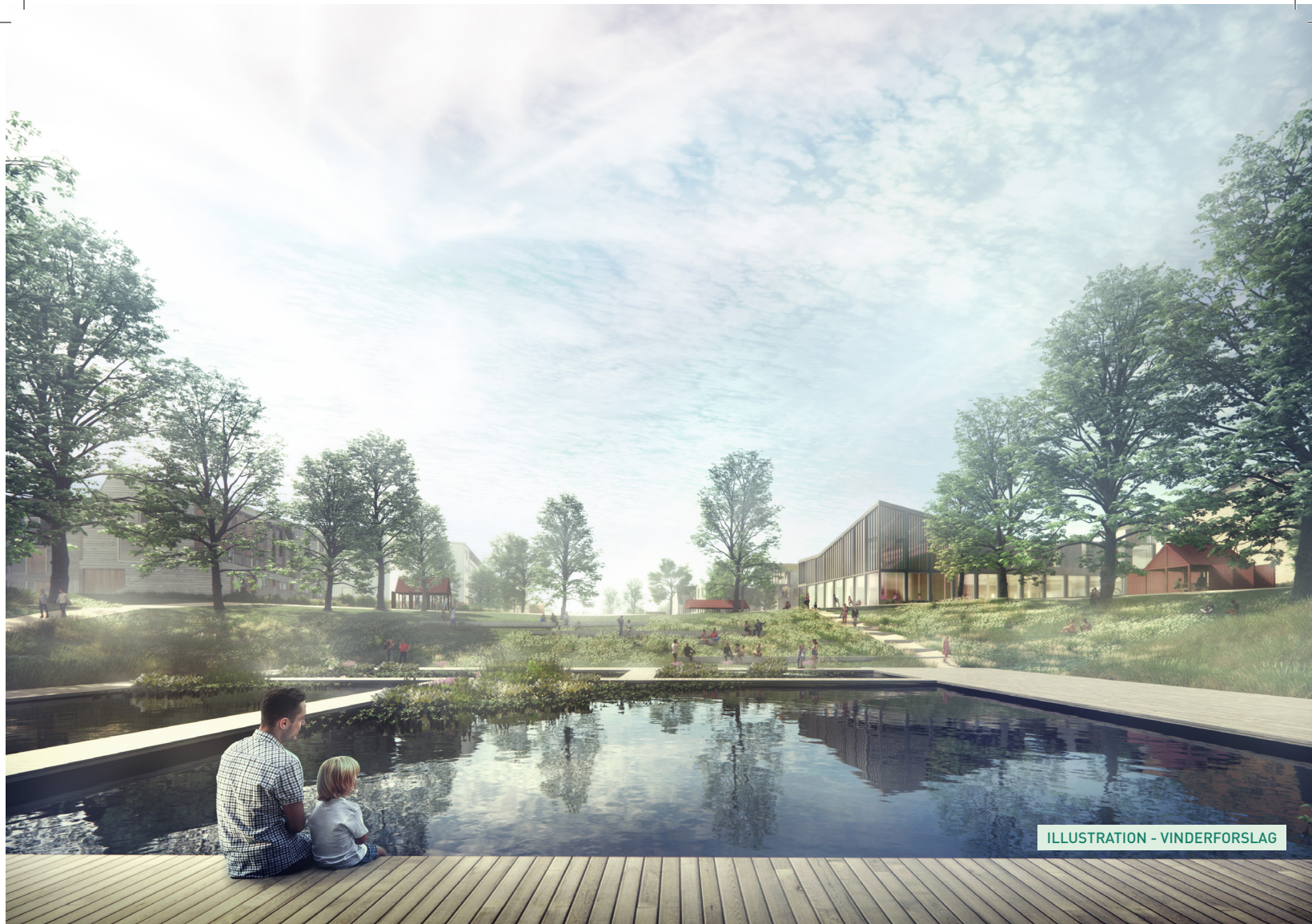
ILLUSTRATION - VINDERFORSLAG