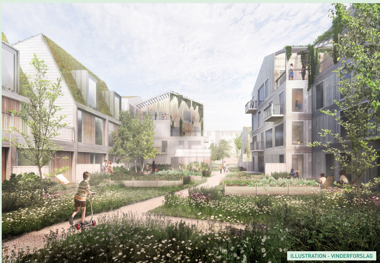
ILLUSTRATION - VINDERFORSLAG